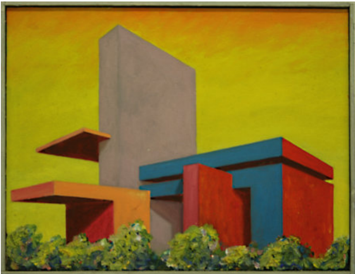
„Saint Martin in The Fields“, Entwurf, 1989, 42 cm x 32,5 cm, Öl auf Nessel

Der Entwurf für dieses Bild ist Teil der Antpöhler-Sammlung in der Bremer Kunsthalle, die Zeichnung ist im Bestand der Sammlung der Bremer Graphothek. Die große Arbeit ist im Besitz des Künstlers.