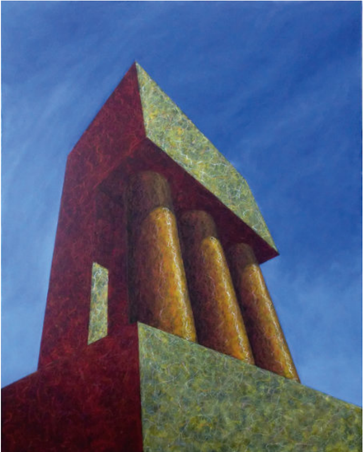
„Tempel mit drei Säulen“, 2008–2015, 150 cm x 120 cm, Öl und Ölpastellkreide auf Nessel