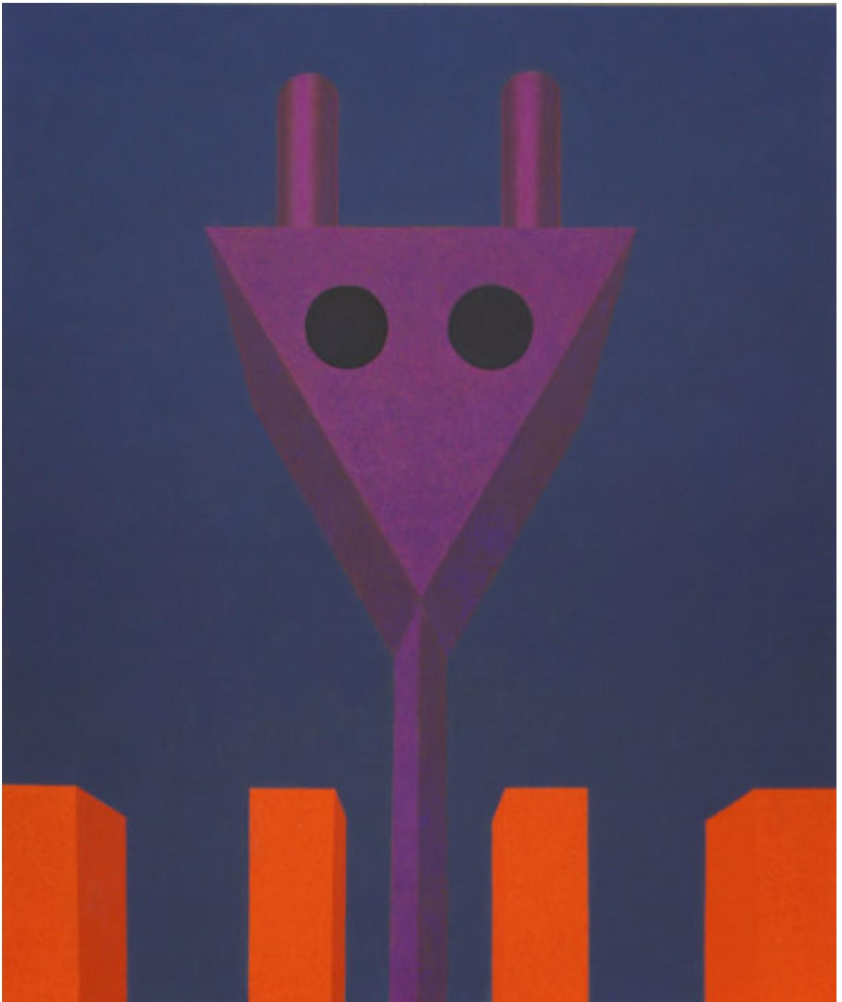
„Fetisch“, 2020, 180 cm x 150 cm, Öl auf Nessel