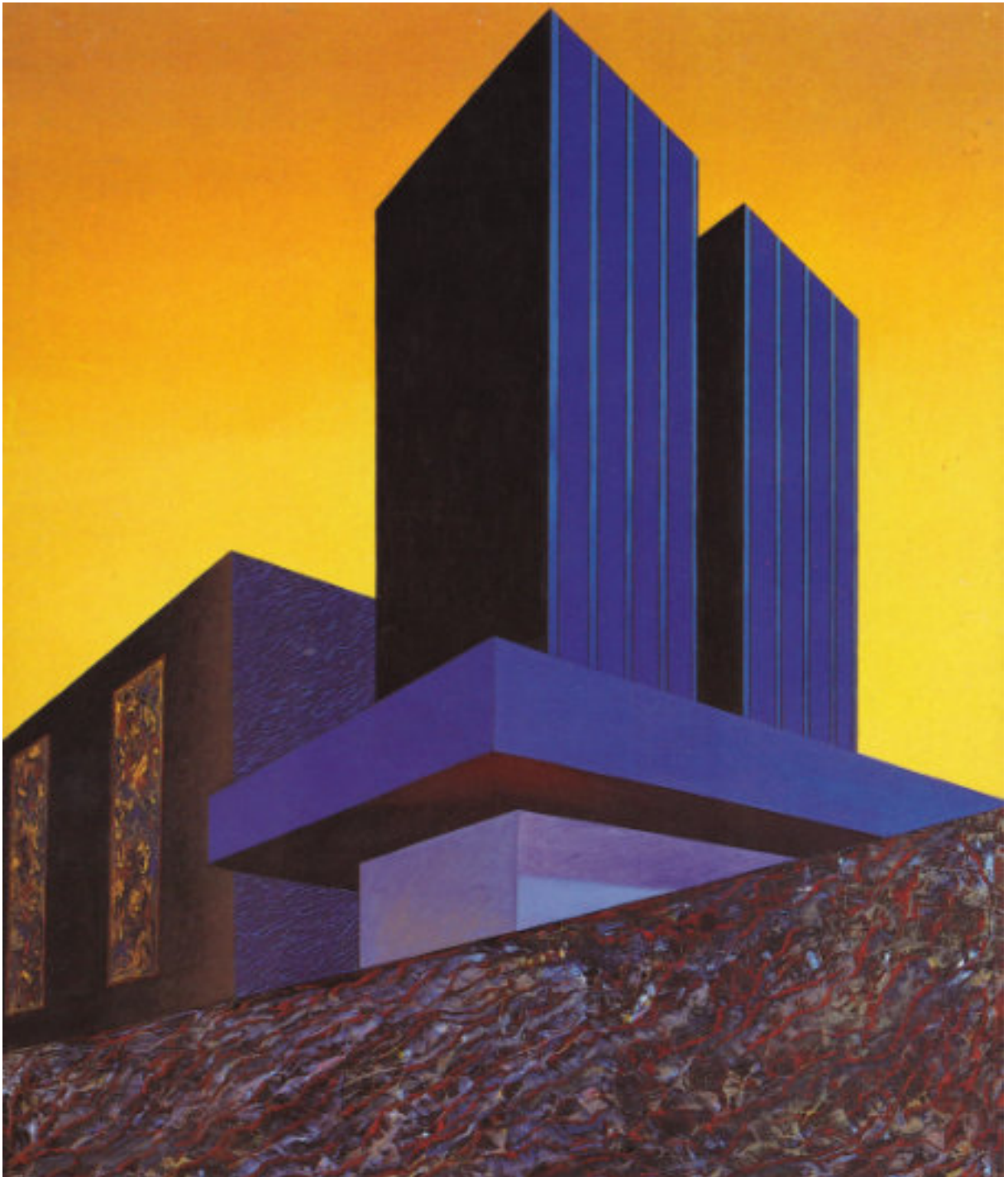
„Ohne Titel (Kathedrale)“, 1988, 180 cm x 150 cm, Öl auf Nessel