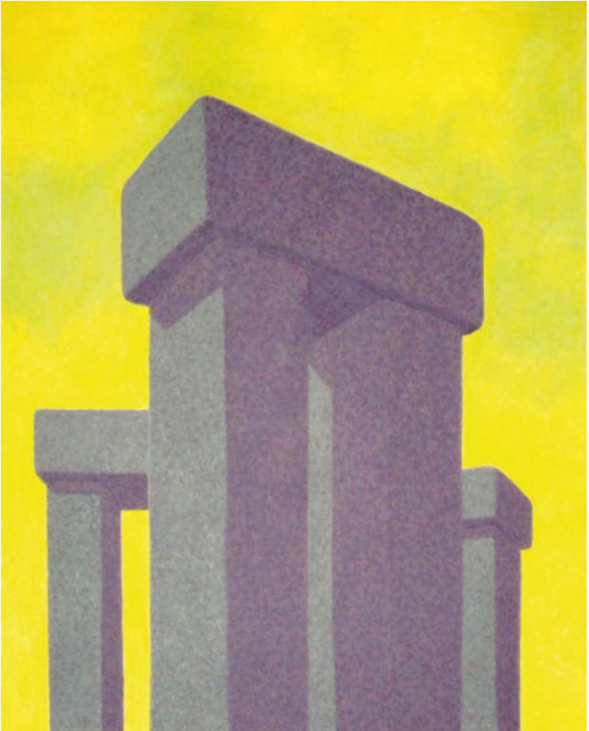
„Walk Alone Around the Stone“, 2019, 150 cm x 120 cm, Öl auf Nessel