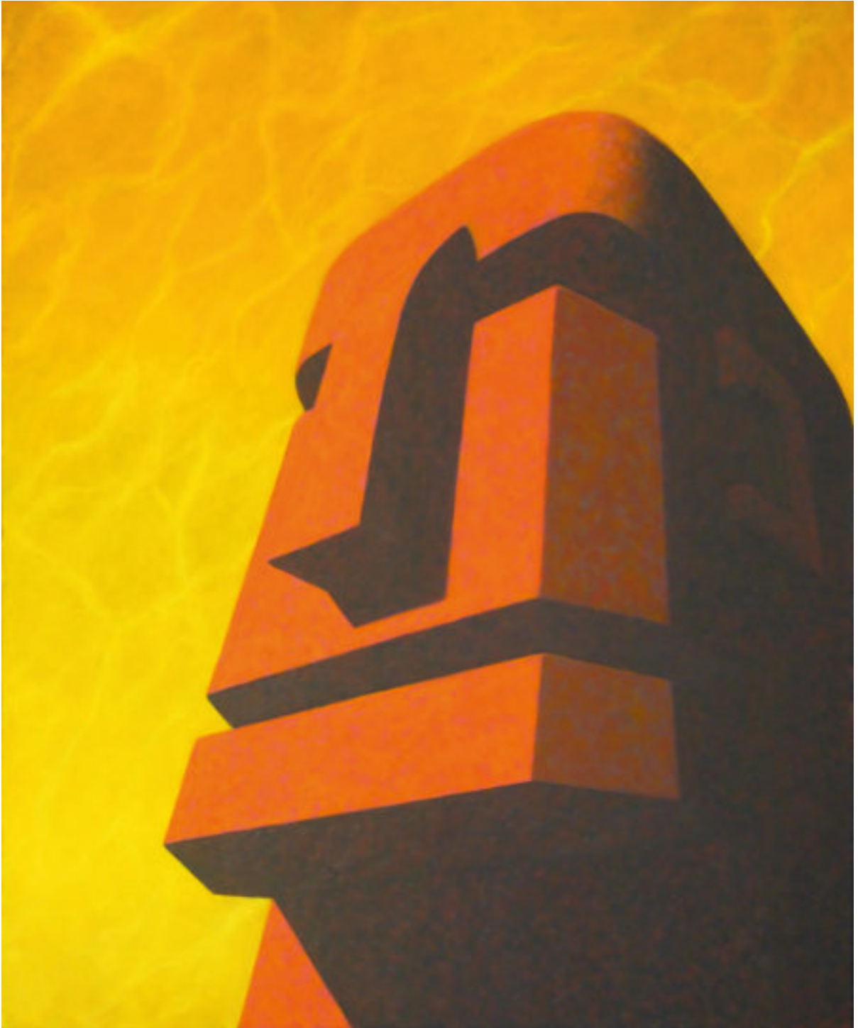
„Betonschädel“, 2017, 150 cm x 120 cm, Öl auf Nessel