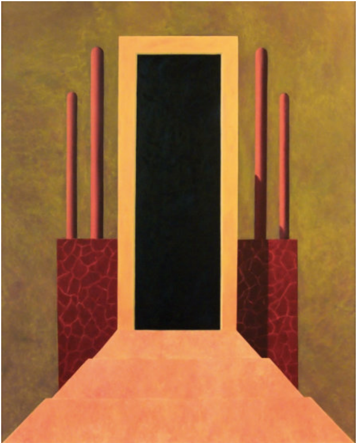
„Obne Titel“, 2017, 150 cm x 120 cm, Öl auf Nessel