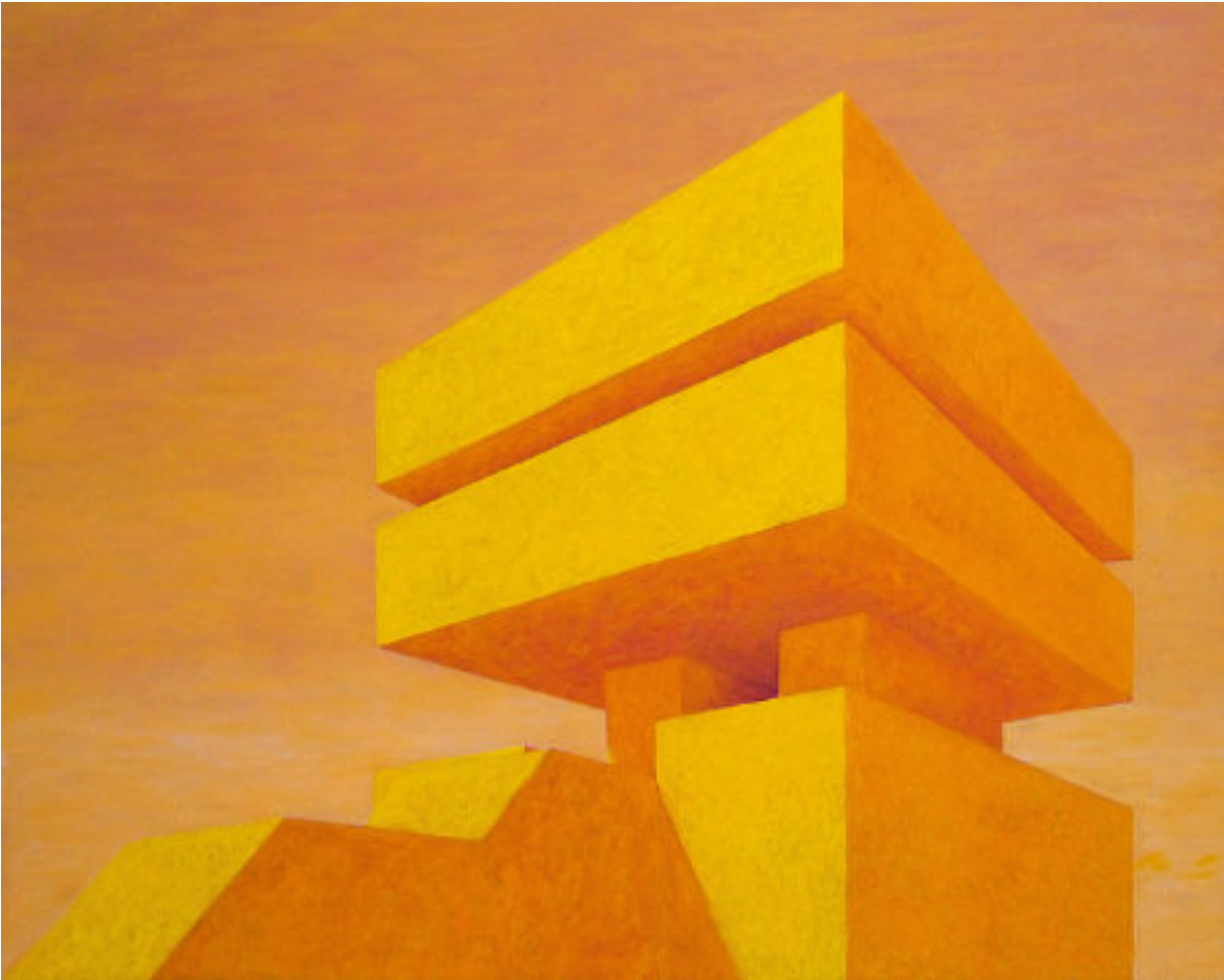
„Tor zur Hölle“, 2023, 120 cm x 150 cm, Öl auf Nessel