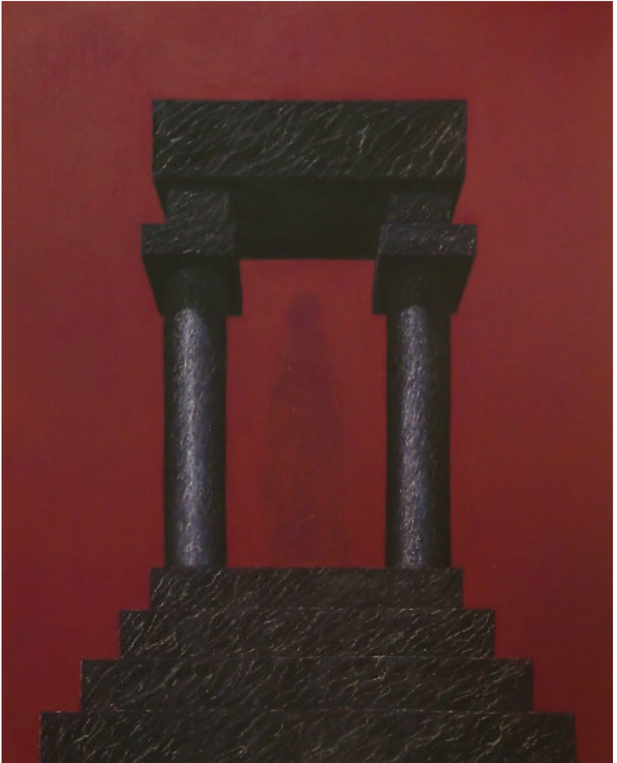
„Bildersturm“, 2018, 150 cm x 120 cm, Öl, Pigmente und Ölpastellkreide auf Nessel