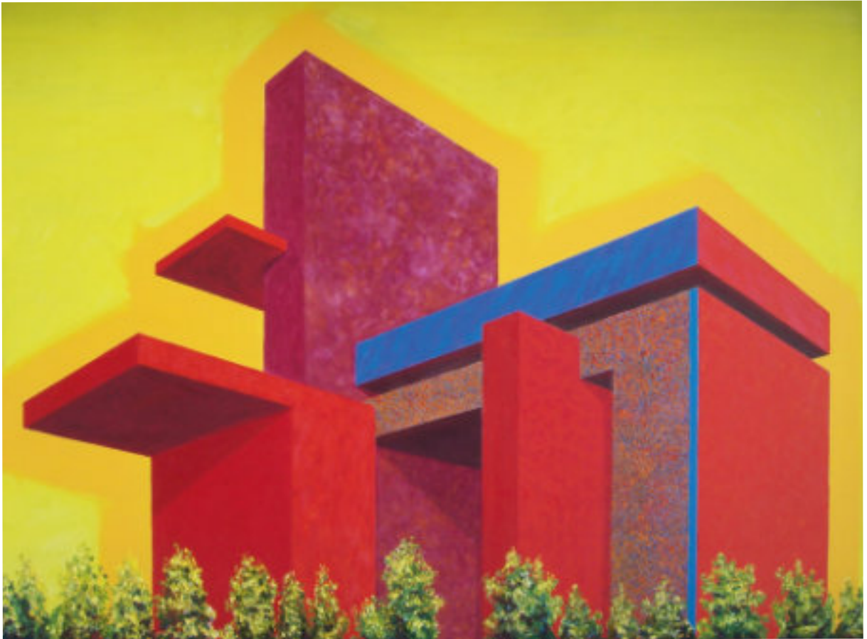
„Saint Martin in The Fields“, 1989, 150 cm x 120 cm, Öl auf Nessel