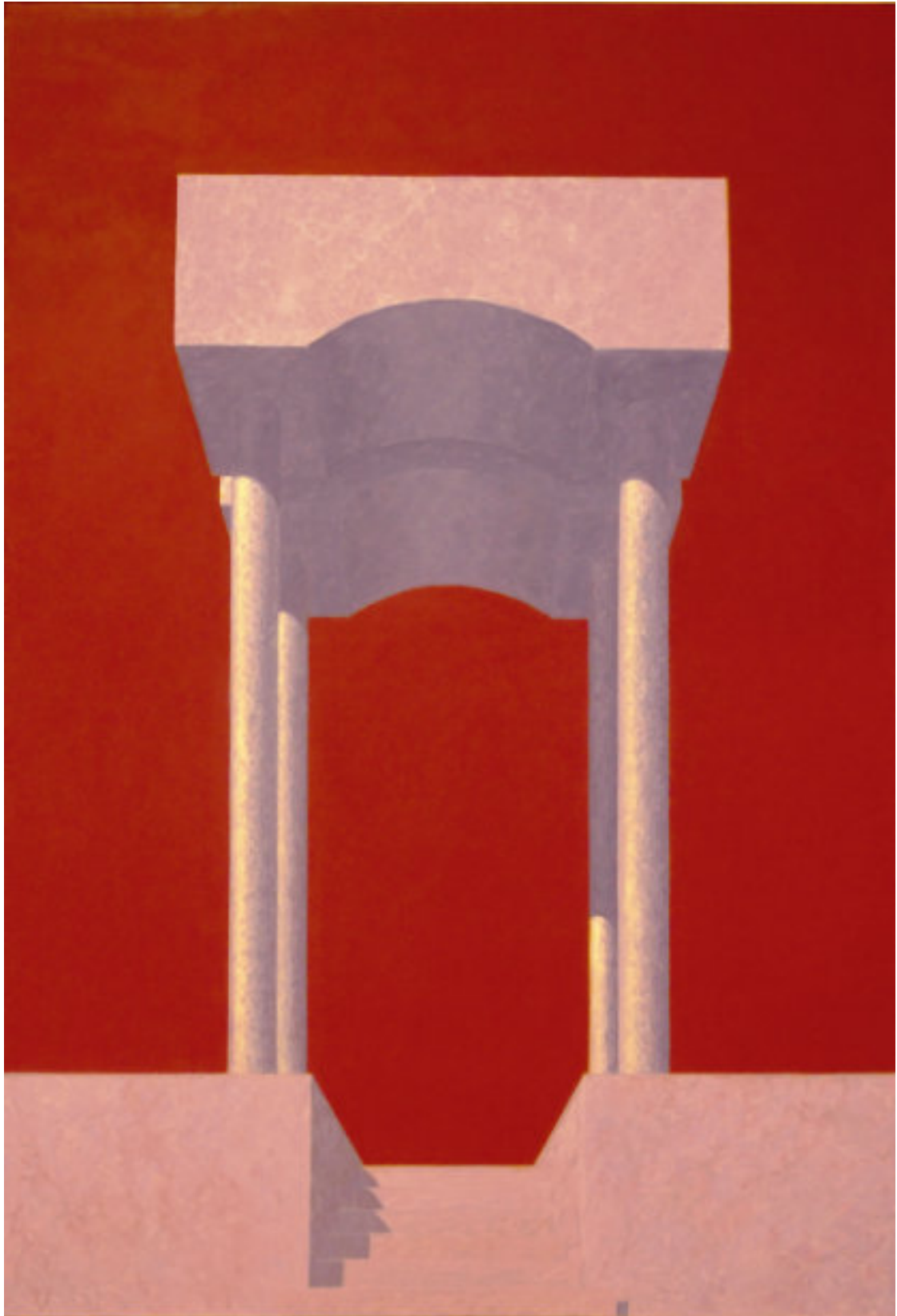
„Rosa Tempel“, 2017, 155 cm x 105 cm, Öl auf Nessel