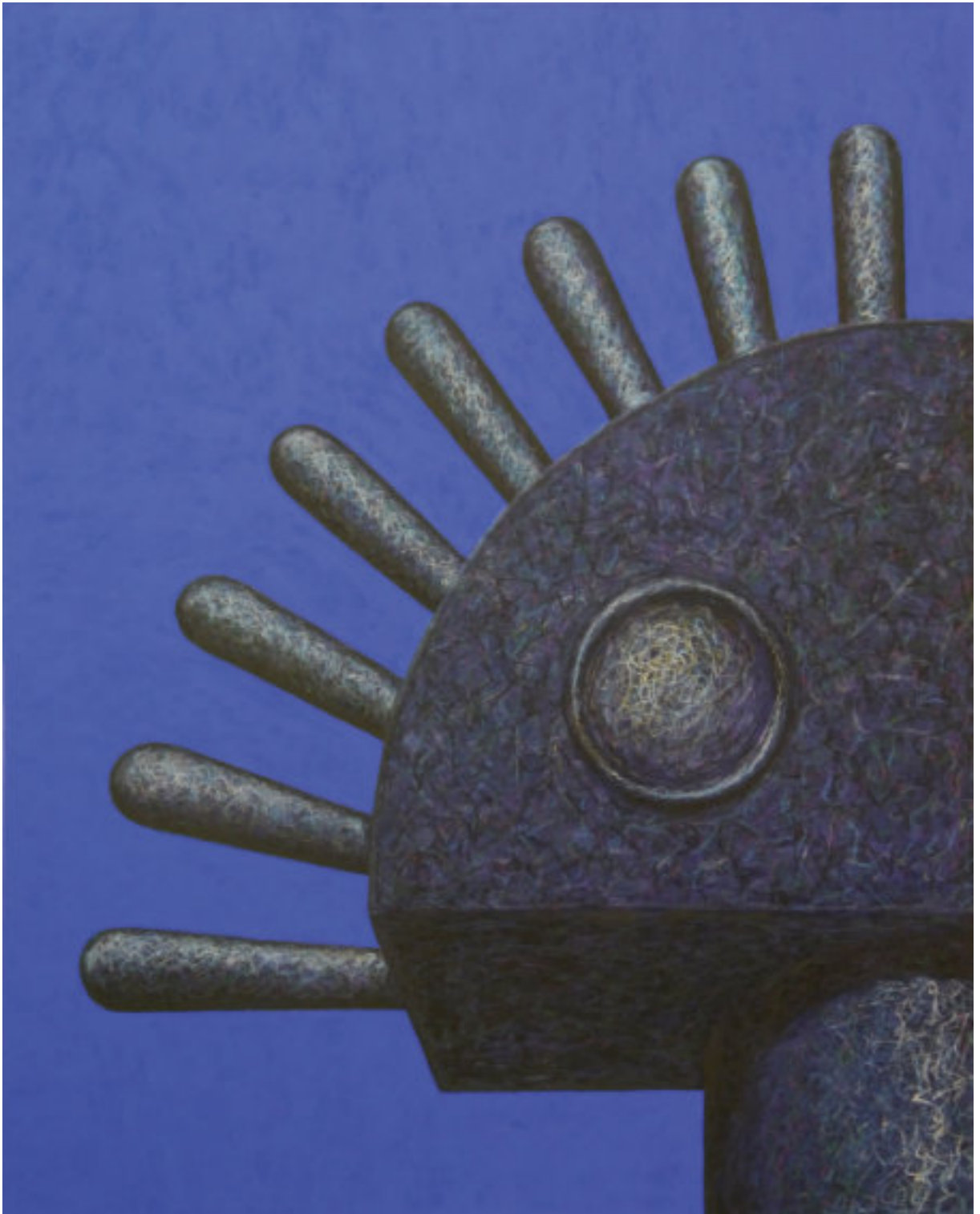
„Gott (selbstgemacht)“, 2019, 150 cm x 120 cm, Öl und Ölpastellkreide auf Nessel